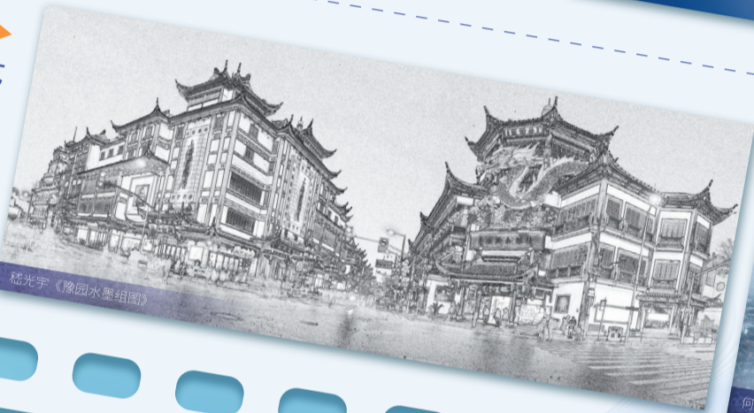
嵇光宇《豫园水墨组画》