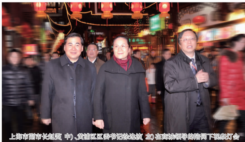
上海市副市长赵雯(中)、黄浦区区委书记徐逸波(左)在商城领导的陪同下视察灯会

本报讯 2月9日晚,为期18天的“第十八届豫园新春民俗艺术灯会”圆满落下帷幕。此次龙年灯会作为豫园灯会被国家文化部正式授牌“国家级非遗项目”以来的首次亮相,在规模、体量、灯组数量与创意、难度等方面都超过了往年。上视、东方卫视、央视和ICS英语新闻频道连续作了直播连线报道,产生了更广泛的社会影响。